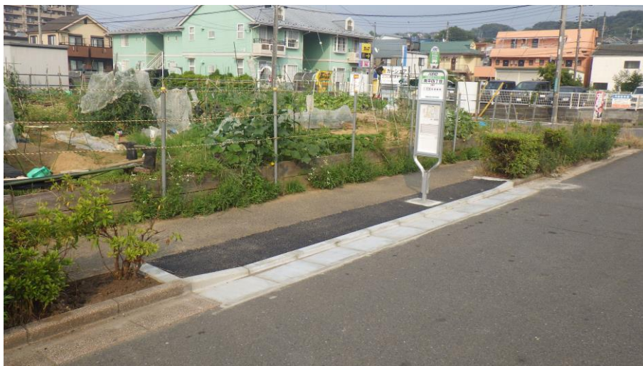
南平四丁目 停留所写真