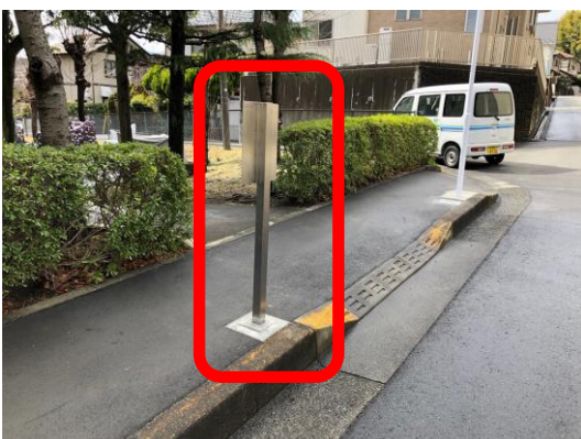
停留所新設箇所（明星大学方面）