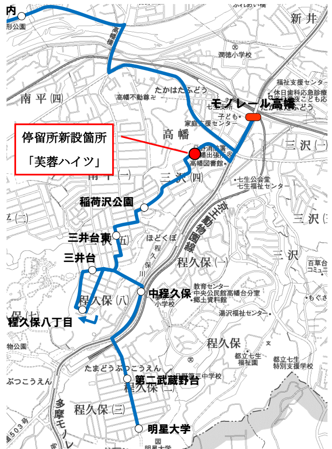
明星ルート路線図