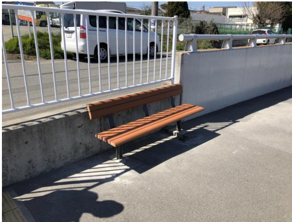
ベンチ設置完了写真（豊田駅北口方面）