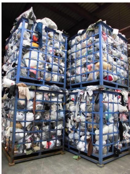
行政回収してきた古布類