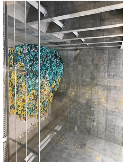
12月19日（金） 17時現在 約192t