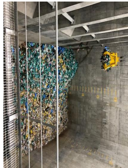
12月20日（金） 17時現在 約210t 累計 約402t