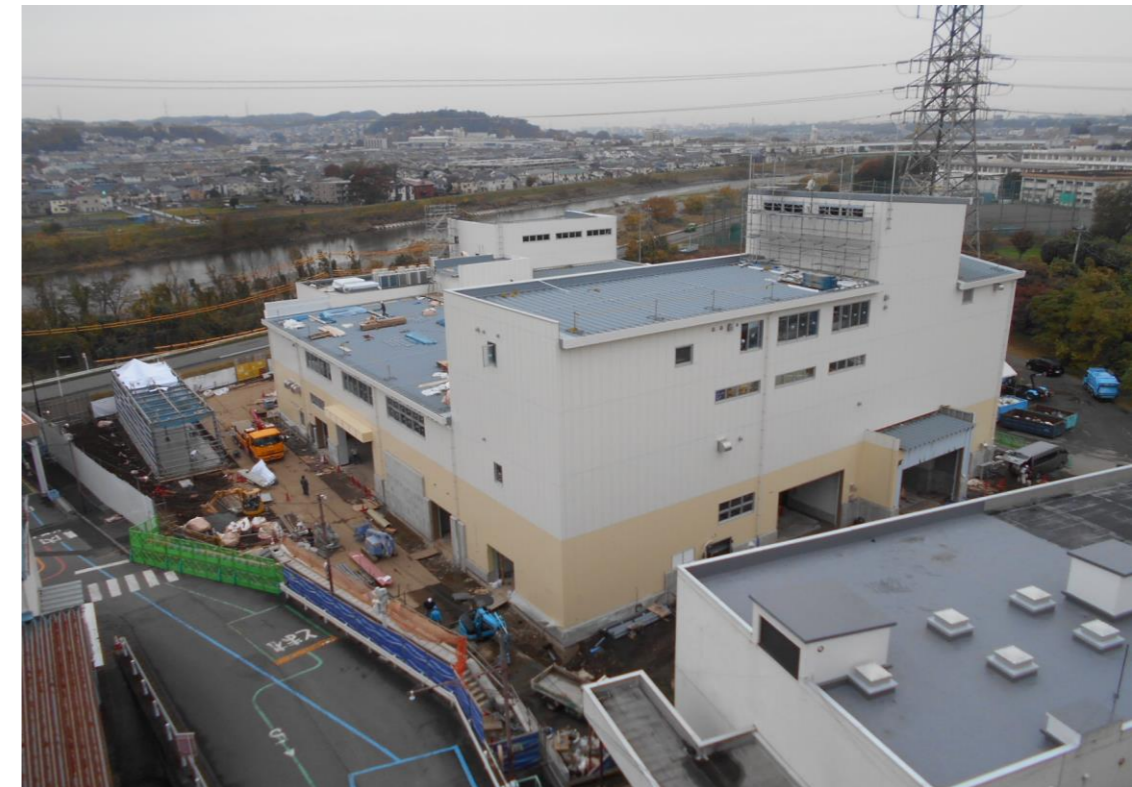
現焼却施設屋上から（11月27日撮影）