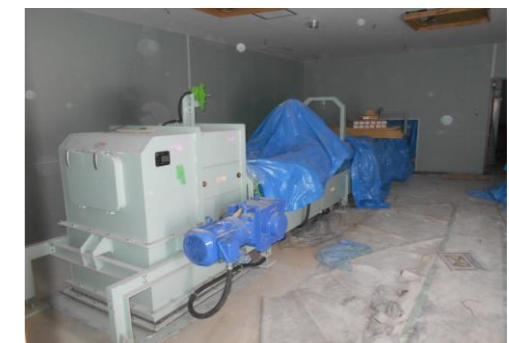
手選別ライン（不燃）