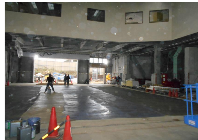
プラットフォーム