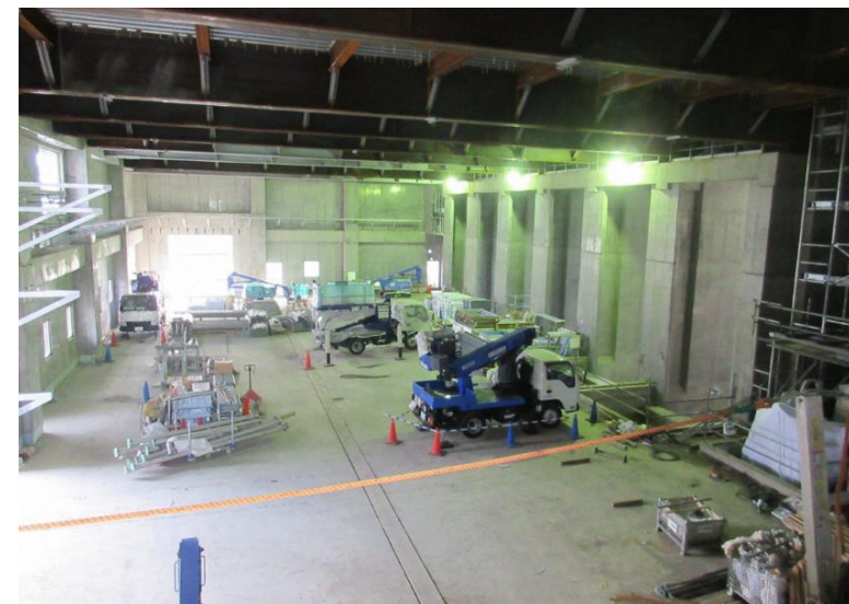
プラットフォーム