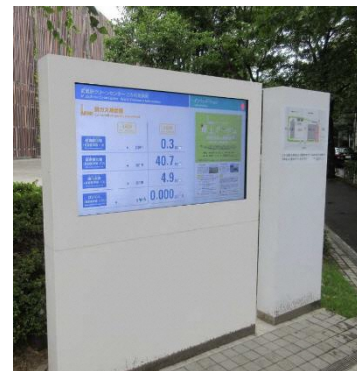
公害防止情報表示盤イメージ