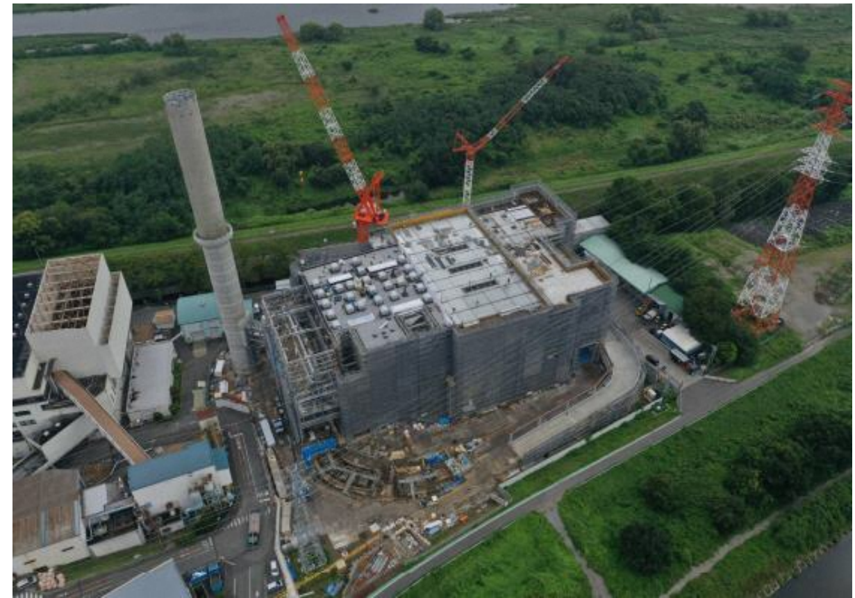
浅川上空から（9月5日撮影）