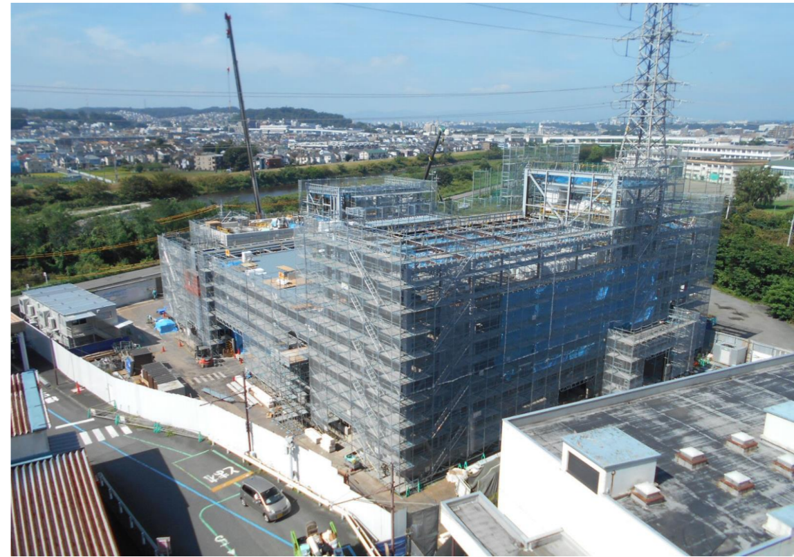
現焼却施設屋上から（9月5日撮影）