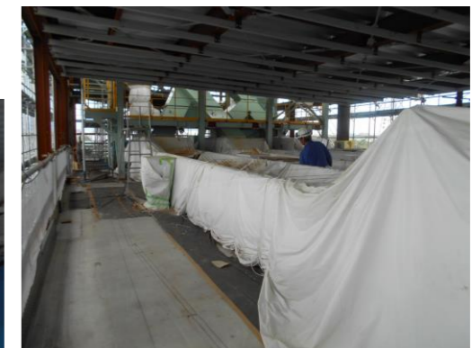
手選別ライン（プラスチック）