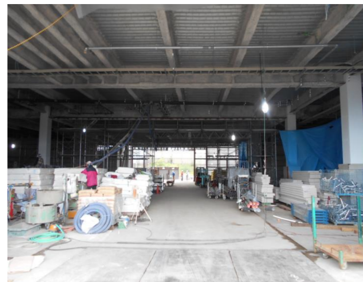
プラットフォーム