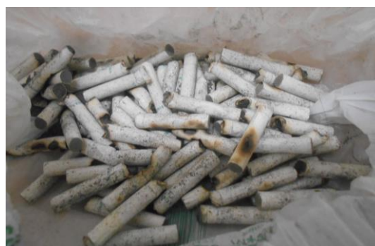
図 プラごみ袋内の『たばこの吸い殻』