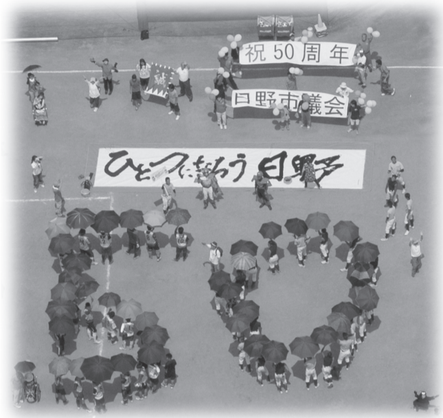
サマーフライト (セスナ機からの空撮)