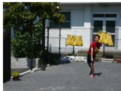
バントワリング・手品・キャッチボール。高校生の投げるボールの速さに「おーっ」の歓声が・・・