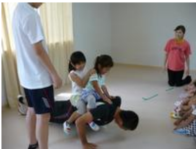
年長さん2人を背中に乗せての腕立て伏せ

あまり小さいこと触れ合う経験のない高校生でしたが、子どもたちのほうが積極的に甘えたり、水遊びでは水鉄砲の餌食に……。びしょびしょにされてしまったお兄さんお姉さん。そんな風に触れ合ううちにすっかりうちとけ、最終日には恒例となった特技披露。「すごーい！！」と今度は憧れの眼差しに……。