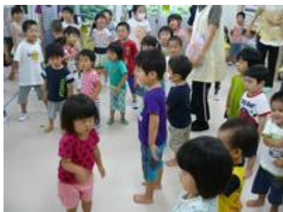
この日みんなで始めて運動会の開会式の体操をみんなで楽しみながらやってみました。