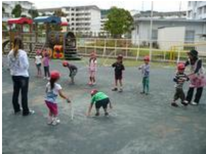
はりきって縄跳びの成果を見せる5歳児