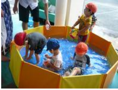
乳児クラスもお水大好き