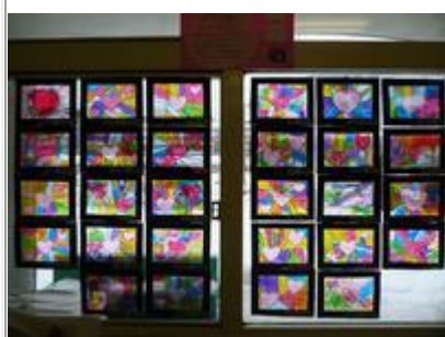
3歳児 ステンドグラス