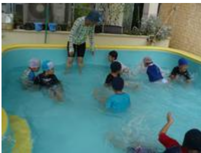
幼児クラスはもっとダイナミック