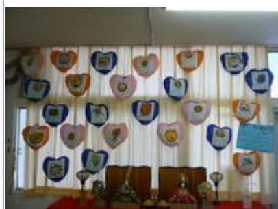
5歳児 ハートのクッション

普段は、なかなか他のクラスの作品を見る機会がないので、この期間はじっくり楽しんでいただけました。