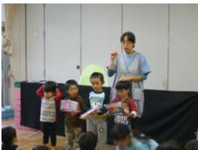
楽しみにしていた誕生児インタビュー