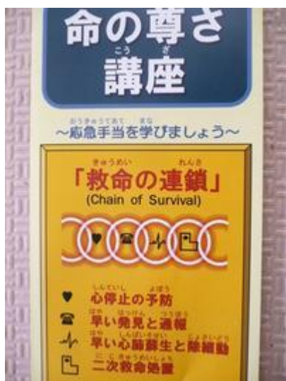
不測の事態に備えての講習の大切さを改めて感じました。