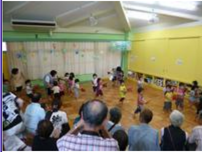
1・2 歳児もかわいい踊りを披露。

もぐさ台保育園の特色の「荒馬踊り」のお披露目会がおじいちゃん、おばあちゃん向けに行われました。