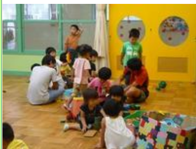
一緒にブロックで遊ぼう！

今年も日野台高校生による奉仕活動が行われ、お兄さんやお姉さんと一緒に過ごしました。