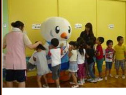
さよなら ゆりーと。 また来てね。