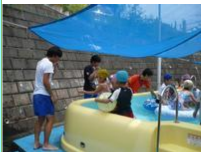
お兄さんと一緒だと 楽しいね