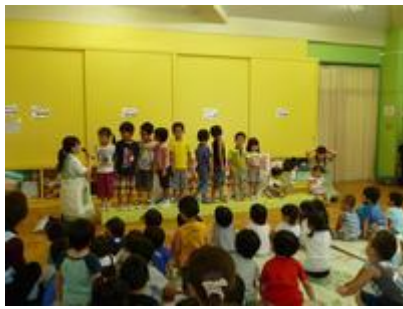
お誕生日おめでとう♥