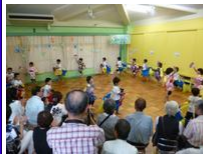
5 歳児の荒馬踊りは、人馬一体になって勇ましく踊りました。

見に来てくださったおじいちゃん、おばあちゃんからたくさんの拍手を頂きました。 ありがとうございました。