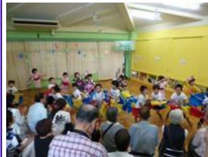
4 歳児は動きが大きくなって来ました。