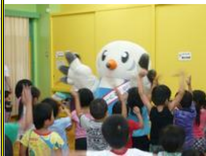
みんなで元気に「ゆりーとダンス」 を踊りました。