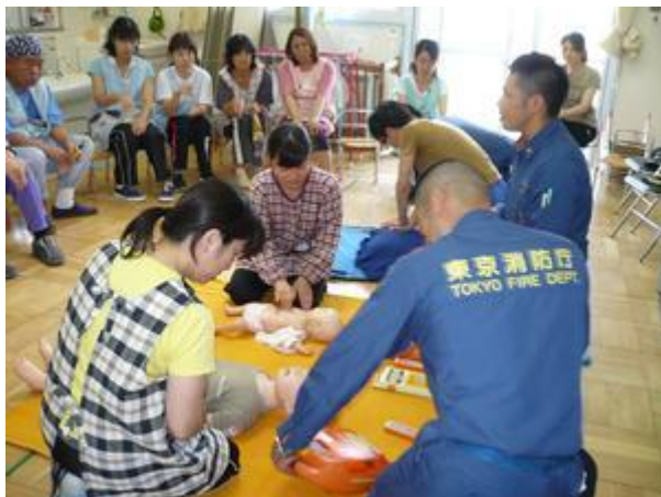
詳しく説明を受けます。