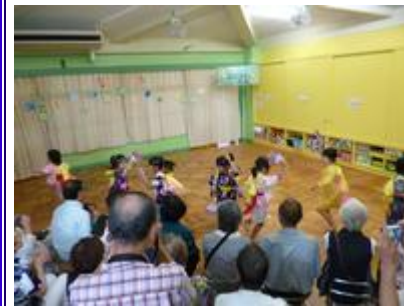
5 歳児の女の子は優雅に女踊りを披露。