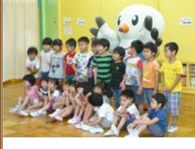
ゆりーとと一緒に 「ハイ、ポーズ！」