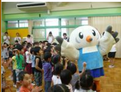
ダンスの最後にみんなでポーズ♥