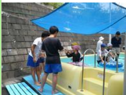
水遊びも一緒だね！