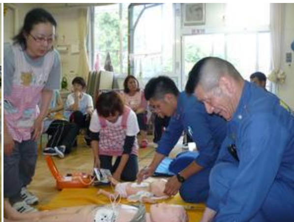
AED も実際に使ってみました。