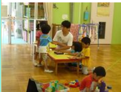
ぬり絵をしようよ