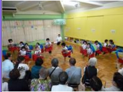
3 歳児は馬を着けて、デビューです！