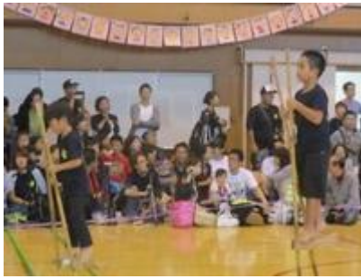
組み体操に大縄に竹馬、一生懸命練習しました。