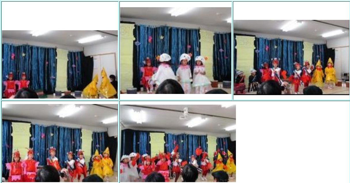
3歳児クラスパンダ組は、みんなで海の生き物になって「絶対にダンスは踊らない！！」と知っているえび姫様にダンスを踊らせるというお話です。 カニ王子の登場でダンスの楽しさを知り、最後はみんなで【エビカニクス】を踊り、フィナーレ！「踊るのって楽しいわー」エビ姫様もご機嫌で踊りました。