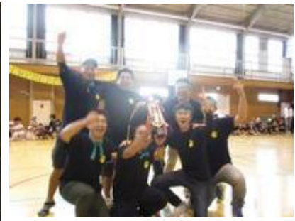
保護者競技では、らいおん組が優勝でした。