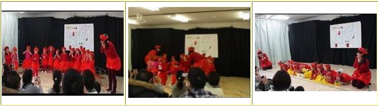
2歳児うさぎ組は、『トマトさんがねー』で始まる絵本を題材に劇遊び。 かわいいミニトマトが、たくさんいましたよ♪