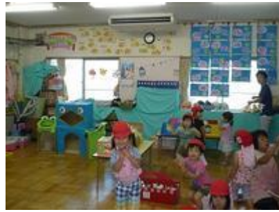
ペンギンやかえるのボールいれゲームがたのしいコーナーです。