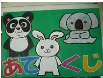
「あてくじコーナー」 幼児クラス向け遊びのコーナー