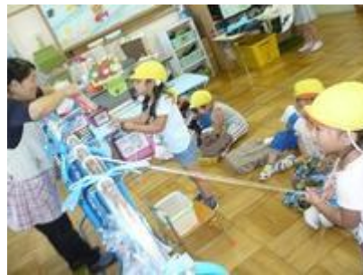
するする・・・なにが当たるかな？！