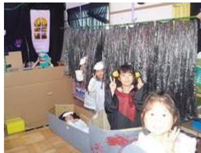
ちいさいクラスのお友だちが来たら、やさしくね！ 電気もつけてあげようね！！