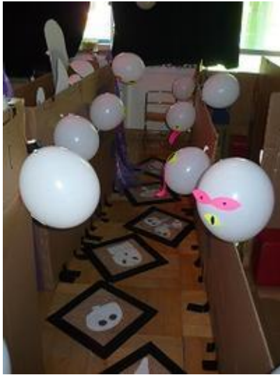
ふうせんおばけだぞー