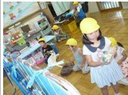
おうちにもって帰って遊ぼう♪