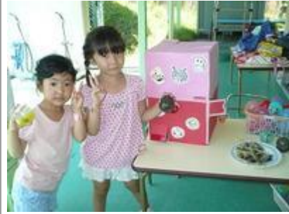
出口では、お土産やさん役のお姉さんがスタンバイ。 「おみやげのガチャガチャマシンをどうぞ！」