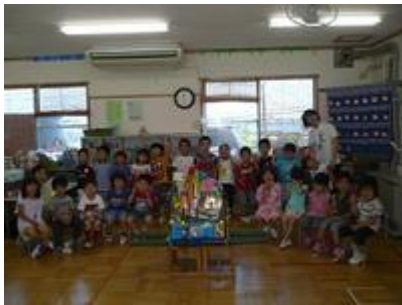
おみこしを作ってお祭りをもりあげてくれた4歳児くま組さん