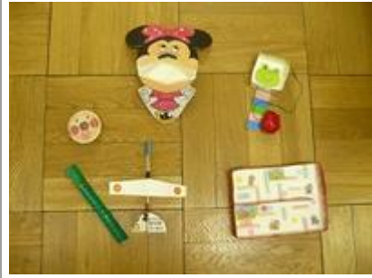
お土産は、職員の手作りおもちゃ！ (おやつで出た、牛乳パック・ゼリーカップをつかって) ゼーンぶりサイクルでつくっています。