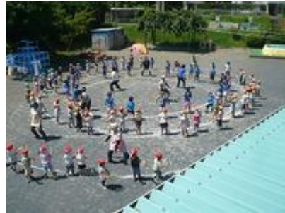
「オープニング」 よさこい踊り