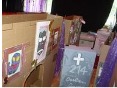
迷路もおもしろいおばや屋敷です。 ここはトンネルです。