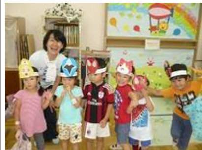
こんなにすてきなお面ゲット。