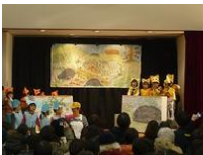
「みんなみーつけた！」 2 歳児りす組