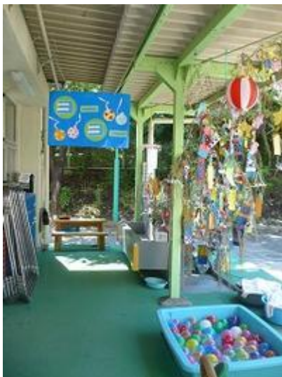
「ヨーヨーコーナー」