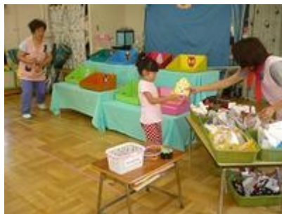
ほしいお面を狙ってわなげです