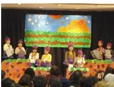
「さつまのおいも」 3 歳児うさぎ組