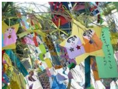
たのしいおまつりを満喫の一日でした。おりひめ・ひこぼしさんありがとう。 これから始まる今年の夏も楽しめますように！