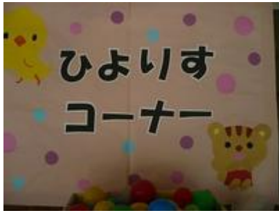
「ひよりすコーナー」 乳児クラス向け遊びのコーナー