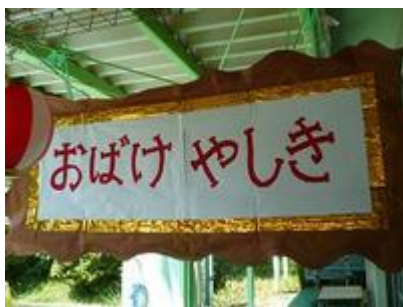
「おばけやしきコーナー」 5歳児らいおん組 年長組さんが考え、話し合い、つくって、おばけ役もやる子どもおばけです！