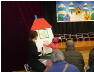
「ひよこサンタはおおいそがし」 1 歳児ひよこ組