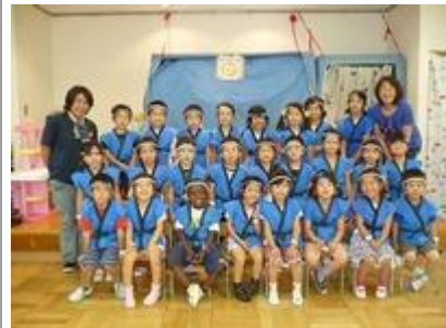
そろいのハッピーで一日なつまつりを盛り上げてくれた年長組のみんな！ たのしかったね！！