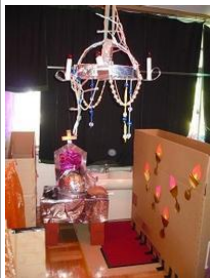
くもの巣シャンデリアもすてき