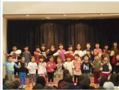
第 I 部 オープニング 「シンデレラのスープ」 3 歳児うさぎ組