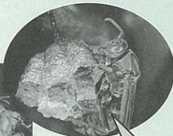
初期の巣と 女王バチ