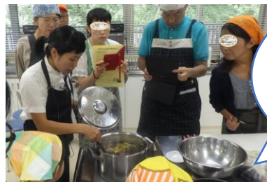
親子でエコクッキングの様子