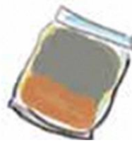
基材 (もみ殻くん炭・ 竹パウダー)