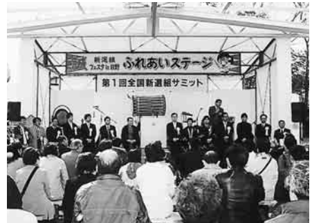
新選組ゆかりの地の関係者が万願寺メイン会場に集合

「新選組!」製作スタッフによる講演も行われ、ゆかりの地の物産紹介や観光振興についての情報や意見を交換、熱い議論が交わされました。