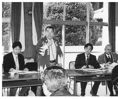
まちおこしへ、活発な意見交換

去る3月13日(土)・14日(日)の両日、新選組にゆかりのある市や町(長岡市、会津若松市、流山市、京都市、函館市、調布市など)の関係者が集まって、まち