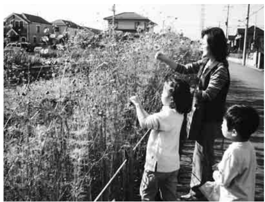
▲秋にはかわいい花を咲かせます

へ参加し、今年も皆さんの手でコスモス通りを作り、秋に花を咲かせてみましょう。種まき後も大切に育ててくれる方をお願いします。参加希望の団体及び個人で申し込みください。