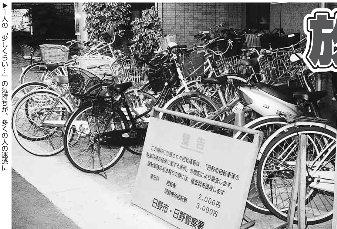
▶1人の「少くらしい…」の気持ちが、多くの人の迷惑に