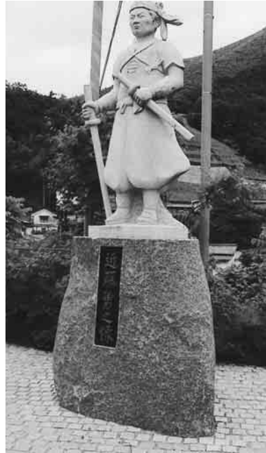
▲甲陽鎮撫隊と東征軍が戦った柏尾古戦場跡に立つ近藤勇の像(山梨県東山梨郡勝沼町)

慶応4年(1868)3月1日、大久保剛(近藤勇)・内藤隼人(土方歳三)らが鎮撫隊として100名ほどを引き連れて江戸を出立、府中宿に泊まった。彦五