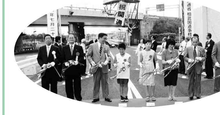
高幡不動駅、日野駅、日野宿本陣、万願寺メイン会場で受け付け