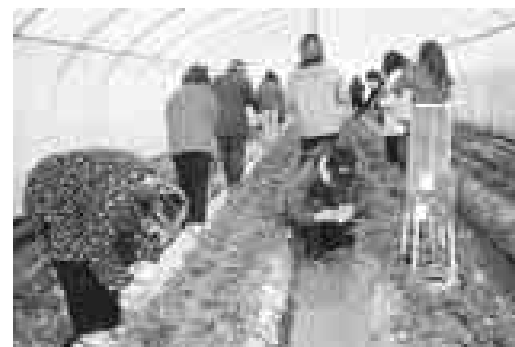
▲句を楽しむイチゴ狩り

◎健康維持増進事業 人間ドックや脳ドックへの補助 ◎健康維持増進事業 映画・観劇等の助成制度：演劇・立川シネマシティ、各種イベントや東京ドーム(巨人戦)の観戦チケット等、あつせん及びローソンチケットの補助 ⑤ハイウェイカード・パス共通カードなどの割引販売