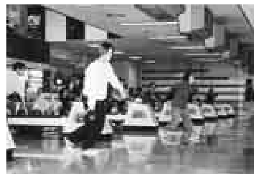
▲各種のレジャーを実施しています

月500円で支えます と事業の発展にお役立てください。 ◎生活資金融資事業 教育・医療・出産・冠婚葬祭・育児時等の生活資金に最高100万円の融資が受けられます(保証人不要。日野市が保証料を負担)。また、併せて住宅・マイカー・教育などの各種「ろうきんローン」が受けられます。 ◎退職金共済掛金補助事業 国や商工会が実施する退職金共済制度に加入・増額すると、1従業員につき1千円の補助が2年間受けられます。 ◎レジャー・レクリエーション補助事業 ①宿泊助成：1泊どこでも1利用に会員2千円の助成(年間2泊まで) ②旅行・宿泊施設の紹介：会社の団体旅行や個人旅行に役立つ格安な海外・国内パック旅行やホテル・旅館などの割引宿泊施設の紹介 ③レジャー施設等の割引制度：テニス・リゾート・ゴルフ・スキー・スノーボード、遊園地などのレジャー施設の割引券や旅先でも利用できるレンタカー・特割クーポンなど