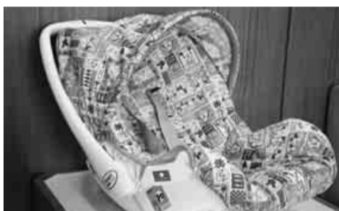
▲チャイルドシートは6歳未満のお子さんを車に乗せる時、使用が義務付けられています

【日時】12月19日(月)午前11時〜正午【会場】東町交流センター【対象】20歳以上の市内在住・在勤・在学者 【体験・ベビーマッサージ】と説明会 【日時・会場】下表のとおり 【対象】市内在住・在勤の4〜