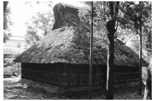
▲奈良・平安時代の住居を想定しています