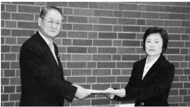
▲日野市男女平等行動計画策定委員長から市長に提出されました

この計画は、「日野市男女平等基本条例」に基づき、市民・事業者・行政の連携・協働のもとに、家庭・職場・地域・学校などあらゆる場面で男女平等を推進することを目的として策定しました。市民・事業者・市職員から構成される日野市男女平等行動計画策定委員会を設置し、検討を重ねるとともに、市民の皆さんのご意見を取り入れ、策定したものです。