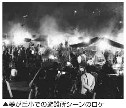
▲夢が丘小での避難所シーンのロケ

「1日」市議会本会議(行政報告、議案上程)「4日」日野市民ふれあい福祉まつり開会式、ガーデニングコンテスト表彰式「5・7・8・9日」市議会本会議(一般質問)「6日」全国市長会議分科会「7日」東京都児童福祉審議会専門部会「12日」市議会本会議(一般質問、議案上程)「14日」ツバメシル原画優秀作品表彰式