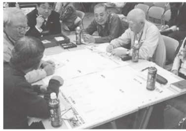
▲討議会では活発な意見が交わされました

が出来ました。 今回の試みは、今まで市政に関心はあるが、声を届けることが出来なかった方に市民参画のきっかけを持っていただけるとともに、市としても今後の市政に生かすことが出来る有意義なものになりました。