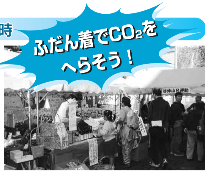
▲くらしのフェスタ販売コーナー