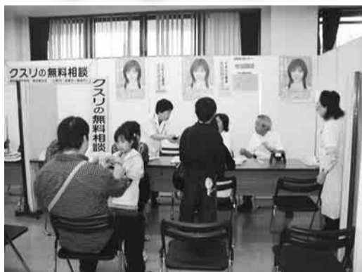
▲昨年の健康相談の様子