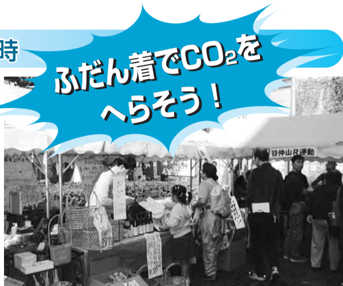
▲くらしのフェスタ販売コーナー