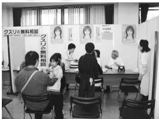
▲昨年の健康相談の様子