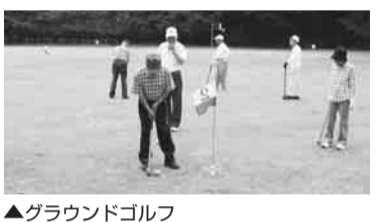
▲グラウンドゴルフ