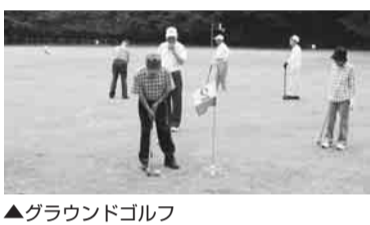
▲グラウンドゴルフ

22日(土)・24日(日)・29日(土)・30日(日)午前9時ノ午後5時 受付 先:文化スポーツ課