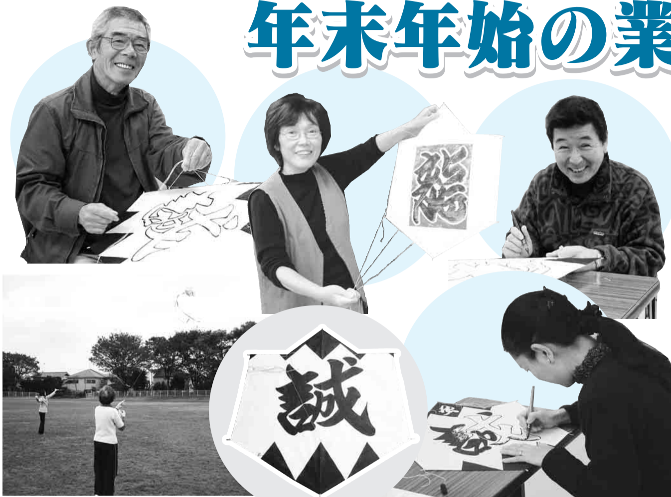
▲凧作り講座(中央公民館にて)

年末年始の市役所業務日程は下表のとおりです。それぞれの施設で日程が異なりますのでご注意ください。なお、ごみ収集・資源物回収スケジュールは8面でお知らせしています。