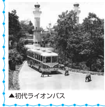
▲初代ライオンバス

多摩動物公園のライオン園 は世界で初めて作られたサフ アリ形式の展示施設です。中 を走るライオンバスは昭和39 年の運行開始以来根強い人気 を誇ります。今月はライオン などのアフリカのネコ科動物