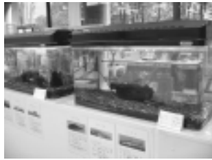
市内で生息している魚を展示

10月5日(月)～30日(金)午前8時30分～午後5時15分 30日は午後4時まで。日曜日、祝日を除く/市役所1階ロビー 三三水族館 市内の河川・用水に生息する魚類などを水槽で紹介しています。10月5日(月)～30日(金)午前8時30分～午後5時15分 30日は午後4時まで。日曜日、祝日を除く/市役所1階ロビー