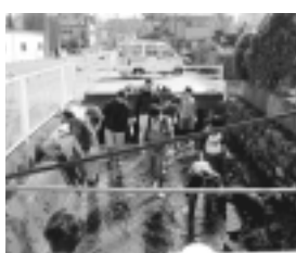
近所の方々を中心に用水を清掃します