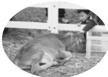
子牛とふれあい広場

14日・15日とも午前10時から会場内3カ所に設置してあるスタンプを集めると抽選で豪華商品が当たります(各日先着1,000人)。 抽選=商工展本部テント