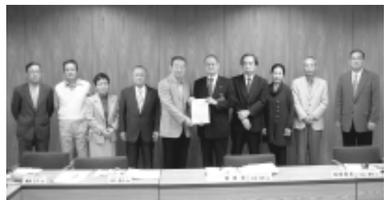
市民評価委員の皆さま

市内21橋の現状調査及びカルテ作成...早急に現状の調査度が高い橋から優先順位付け