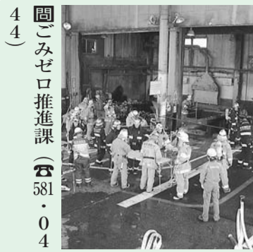
図ごみゼロ推進課(☎581・044)

■平成25年度「選べる学校制度」の小学校希望状況をお知らせ 小学校希望状況は左表のとおりです。希望校の変更は、9月5日(水)～7日(金)午前9時～午後5時に印鑑を持参し、市役所5