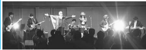
「おとなのバンド大賞」企業職場部門で全国最優秀賞を受賞した実力派ロック・R&Bバンドのクロスロードが出演します。