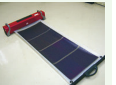
▲モバイルソーラーユニット

貸出期間…最長30日間(市内に住所を有する個人・団体および「ふだん着でCO 2 をへらそう宣言」を行った個人・団体)市役所3階環境保全課で受け付け※貸出機器数に限りがありますので、申込多数の場合はお待ちいただくことになります