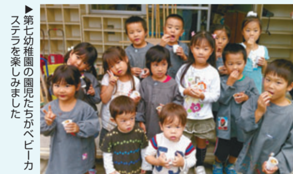
▶第七幼稚園の園児たちがベビーカステラを楽しみました

マスコットキャラクターのエコマとエコアラの焼印を押したベビーカステラを、市立幼稚園5園でふるまいました。お迎え時にあわせて、子どもたちと保護者が一緒に焼きたてのベビーカステラを楽しみ、保護者