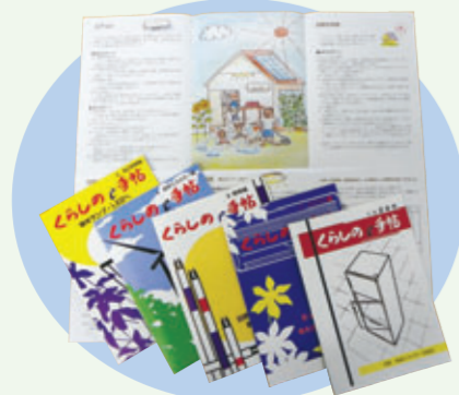
▲家電製品の使い方などを分かりやすく解説した「くらしのe手帖」