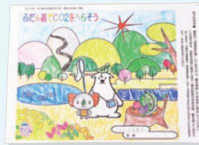
▲エコマ・エコアラが焼き上がり!

省エネや省資源への取り組みは、家族みんなで取り組む必要があります。今後も市民の皆さまへの啓発では、キャラクターたちが活躍します。