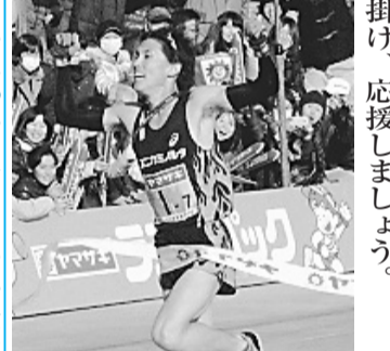
平成25年度全国中学生人権作文コンテスト東京都大会で市内中学生が入賞

3大会連続優勝を目指す選手たちは市内でトレーニングに励んでいます。見かけた際は声を掛け、応援しましょう。