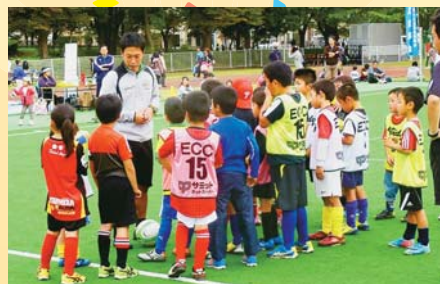
▲サッカークリニック