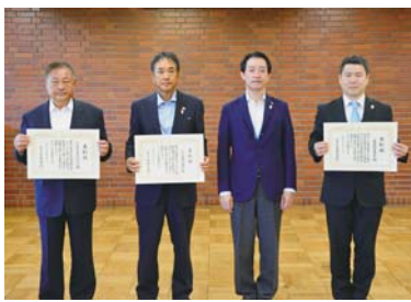
▲左から(株)トウトエンジニアリング、(株)滝沢建設、市長、三栄建設(有)

▶三栄建設(有) (工事名…(仮称)豊田南地区1号公園内集会所施設建築工事、同施設外構工事)