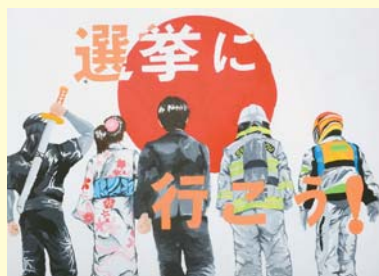
「日野市最優秀賞」 (全国審査・東京都優秀作品) 選挙に行こう！ (三沢中3年 志茂優太郎)

日時 1/18(月)～28(木) ※18日は13:00から。日曜日を除く 会場 市役所 1階市民ホール