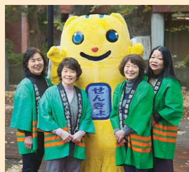
日野市明るい選挙推進委員の皆さま

今号の表紙は、日ごろから投票率の向上など選挙啓発活動に協力していただいている日野市明るい選挙推進委員の皆さまです。ふだんは成人式で新有権者への選挙啓発活動を行ったり、いざ選挙となれば公正な選挙が行われるよう、投票所で投票立会人を務めていただいています。推進委員の皆さまの活動で、日野市の選挙が支えられています。